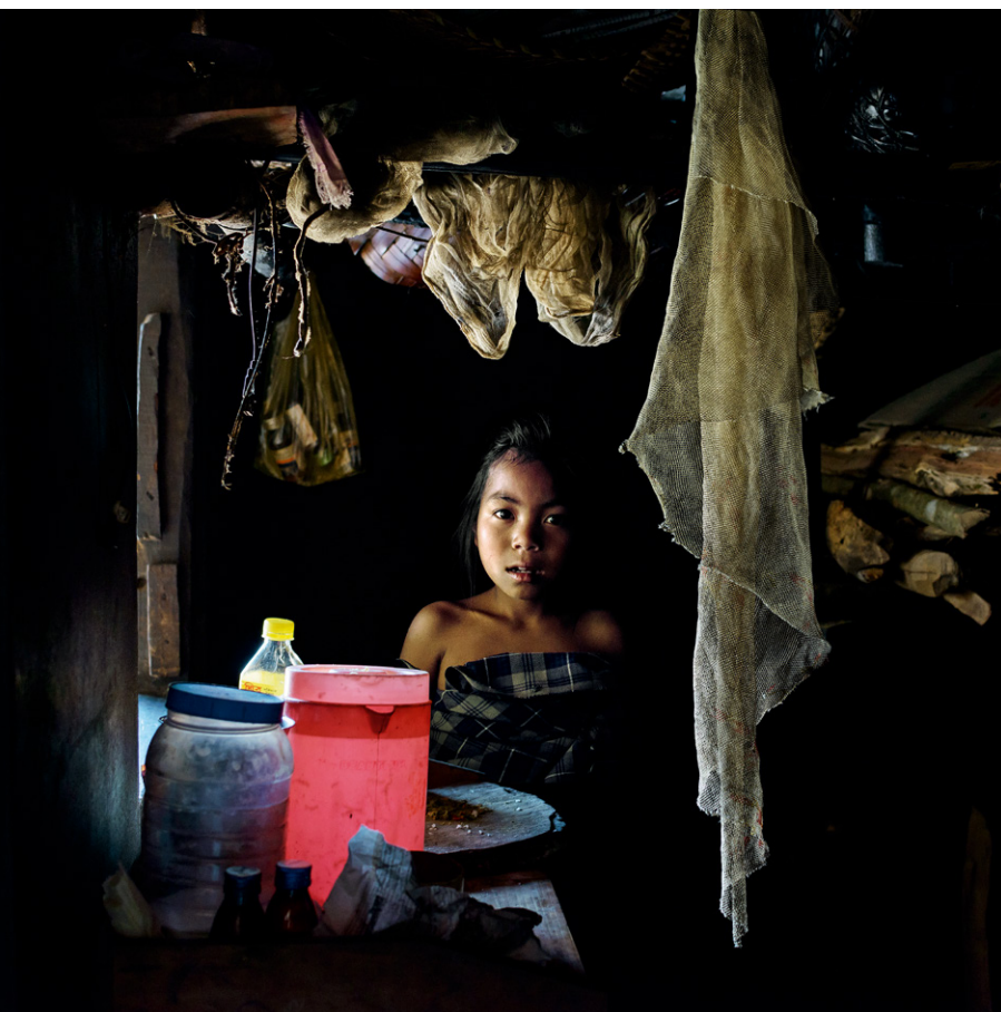
Felix Schoeller Photo Award 2015 Seite 16

Christian Werner 74 – Genozid und Vertreibung Canon Profifoto Förderpreis Seite 50