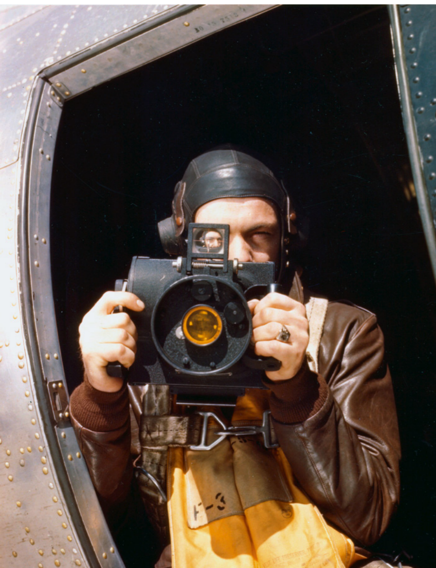
Photographers Seite 36