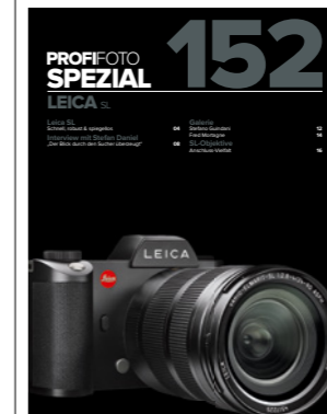
Das Heft im Heft: 20 Seiten rund um die Leica SL