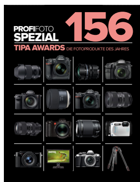
Das Heft im Heft: Die Fotoprodukte des Jahres