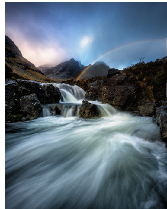
SIGMA 12-24mm F4 DG HSM | Art – Mehrere Belichtungen zwischen 1/8 s und 30 s, ISO 100 Blende 11