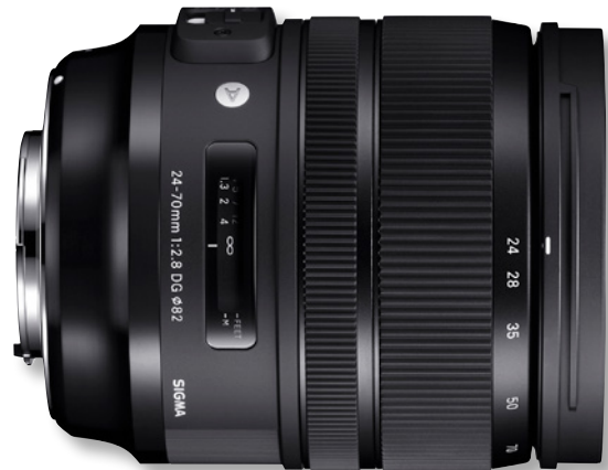
SIGMA 24-70mm F2,8 DG OS HSM | Art

tische Leistung im gesamten Zoom-Bereich erzielt wird. Asphärische Linsen moderner Hochleistungs-Objektive erfordern spezielles Fachwissen in der Konstruktion und Herstellung. Aufbauend auf seiner Erfahrung integrierte Sigma auch in das 24-70mm F2,8 DG HSM | Art ein asphärisches Linsenelement, das eine extrem hohe Auflösung erzielt. Dieses Element ist in der Mitte wesentlich dicker als an den Rändern. Die Herstellung dieser ungewöhnlichen Form ist ein Meisterstück der Fertigungstechnologie. Zudem bearbeitet Sigma die Oberfläche dieses asphärischen Linsenelements unter Einhaltung ultrapräziser Toleranzen, die in einem Hundertstel eines Mikrometers gemessen werden. Diese extrem feine Oberfläche ermöglicht dem 24-70mm F2,8 DG HSM | Art, ein sehr natürliches und weiches Bokeh zu erzeugen, ohne die sichtbaren konzentrischen Ringe, die häufig bei herkömmlichen asphärischen Linsenelementen zu finden sind. Bei weit geöffneter Blende bietet dieses Objektiv einen außergewöhnlichen fotografischen Ausdruck. Der fokussierte Motivbereich wird außergewöhnlich scharf abgebildet, während der Hintergrund ein wunderschönes Bokeh mit lediglich minimalen sphärischen Aberrationen aufweist. Da lichtstarke Zoom-Objektive oft mit weit geöffneter Blende genutzt werden, hat