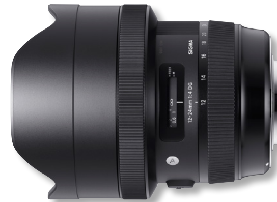
SIGMA 12-24mm F4 DG HSM I Art

Die hohe Lichtstärke bietet außerdem das notwendige Potenzial, um – wie unter anderem bei Astrofotografie wünschenswert – möglichst viel Licht bei kurzen Verschlusszeiten einzufangen. Die Möglichkeit, die Belichtung einer Aufnahme sich bewegender Motive allein durch die