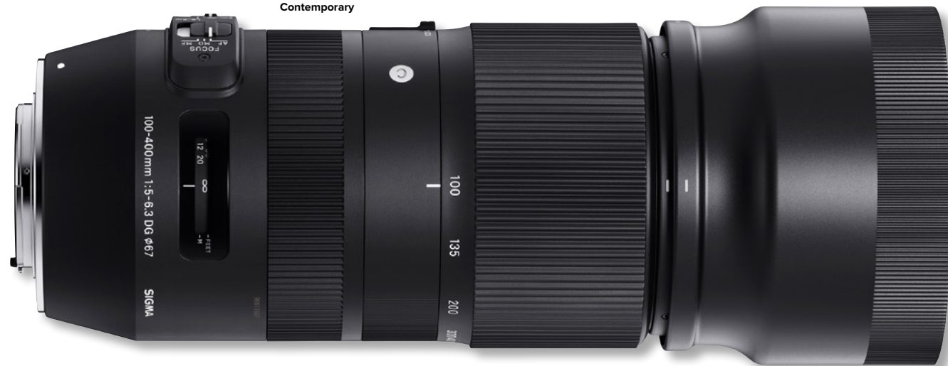
SIGMA 100-400mm F5-6,3 DG OS HSM | Contemporary

gepasst werden. Außerdem ermöglicht das USB-Dock Individualisierungen wie beispielsweise Firmware-Updates und die Fokusjustage. Im Individualisierungs-Modus können die AF-Geschwindigkeit und der Fokussierbereichsbegrenzer, mit dem der gewünschte Fokusbereich eingegrenzt wird, eingestellt werden. Für die Einstellungen des optischen Stabilisators kann außerdem zwischen „Dynamischem OS-Modus“, „Standard“ und „Moderatem OS-Modus“ gewählt werden. Der HSM (Hyper Sonic Motor) sorgt auch hier für einen schnellen und geräuschlosen AF. Durch weitere Verbesserung des Antriebsalgorithmus der vorherigen Modelle wurde zusätzlich eine Steigerung der Fokusgenauigkeit im Schärfenachführungs-AF (AF-C) erreicht. Die Sigma Tele-Konverter, die speziell für die neuen Objektiv-Pro-