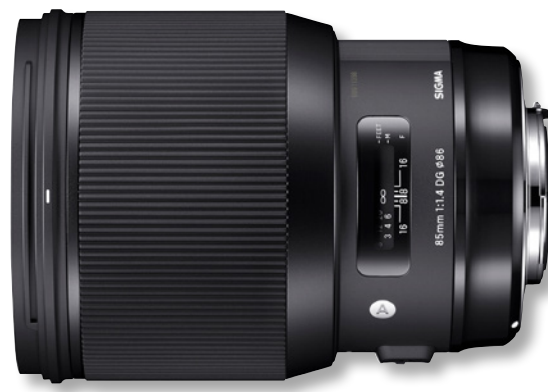
SIGMA 85mm F1,4 DG HSM | Art

verschwimmen lassen kann. Hinzu kommt, dass 14 Linsenelemente in 12 Gruppen verbaut sind – eine bemerkenswerte Struktur, die die ultrahohe Auflösung des Objektivs ermöglicht.