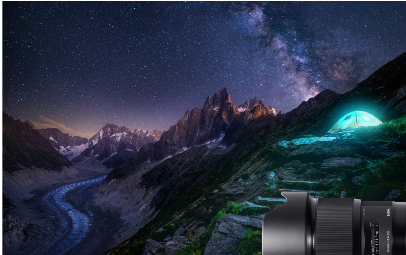
Timeblending – SIGMA 20mm F1,4 DG HSM | Art, mehrere Belichtungen zwischen 13 s und 4 Min., ISO variabel, Blende variabel