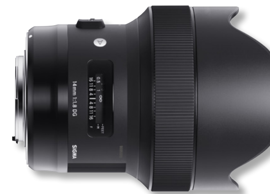
SIGMA 14mm F1,8 DG HSM I Art

Das neue 24-70mm F2,8 DG OS HSM ist das lichtstarke Standard-Zoom-Objektiv im Sigma Sortiment. Das Allzweck-Objektiv deckt eine Vielzahl an Aufnahmesituationen ab. Zur Ausstattung gehört auch hier ein Hyper-Sonic-Motor (HSM) für einen ultraschnellen Autofokus, ein leistungsstarker optischer Stabilisator (OS), ein staub- und spritzwassergeschützter Anschluss mit Gummidichtung und ein Metall-Tubus. Das von Grund auf neu entwickelte Objektiv verfügt über drei SLD-Glaselemente und vier asphärische Linsenelemente. Um eine hervorragende Bildqualität von der Bildmitte bis zum Rand des Fotos sicherzustellen, minimiert das optische System Koma, bei denen die Lichtstrahlen zerstreut und ähnlich einem Kometenschweif abgebildet werden würden, sowie Farbquerfehler, die nicht über die Blendensteuerung korrigiert werden können. Das optische System reduziert zudem Verzeichnungen, die oft bei Weitwinkelaufnahmen auftreten, so dass eine außergewöhnliche op-