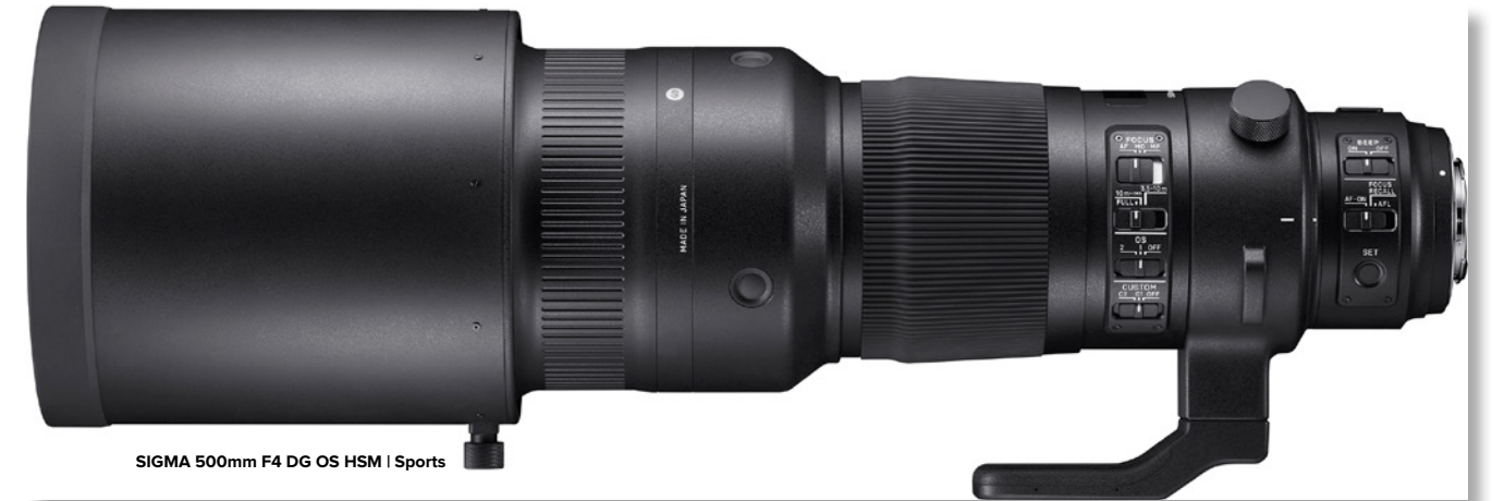
SIGMA 500mm F4 DG OS HSM | Sports

Da Fotografen für Aufnahmen mit einem solchen Super-Tele-Objektiv oft ein Einbein- oder Dreibein-Stativ verwenden, ist die Stativschelle groß und extrem stabil gestaltet. Auch die antistatische Nickelbeschichtung der Stativschellenteile erhöht die Qualität und Beständigkeit der 90°-Rastung. Darüber hinaus wird es mit dem neuen 500er noch einfacher, zwischen dem Quer- und dem Hochformat zu wechseln. Um das Objektiv losgelöst von den 90°-Rastungen ausrichten zu können, lässt sich die Rastung am Objektiv per Schalter auskoppeln. Der speziell konzipierte Tragegurt kann an der Stativschelle befestigt werden und dient dem einfachen Transport. Das entlastet auch den Anschluss der Kamera, an der das Objektiv angebracht ist. Das Objektiv beinhaltet ein SLD- und zwei FLD-Glaselemente, die