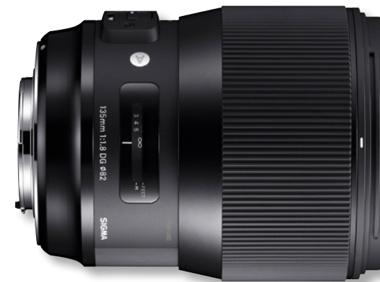
SIGMA 135mm F1,8 DG HSM | Art

Mit einer Lichtstärke von F1,8 baut Sigma die Art-Produktlinie für Vollformat-Kameras außerdem mit einem neuen 135mm-Tele aus. Objektiv wie das 135mm F1,8 DG HSM | Art werden häufig als Basis-Brennweite eingestuft und bieten einen starken perspektivischen Komprimierungseffekt: Auch bei einem vergleichsweise nahen Motiv ermöglicht das Tele dem Fotografen, eine Vielzahl dramatischer Perspektiven zu erzeugen. Der Komprimierungseffekt brilliert sowohl bei Close-ups als auch bei Ganzkörperporträts und er-