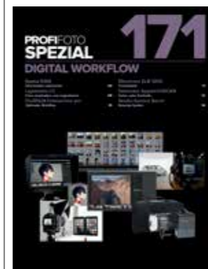
Das Heft im Heft: 16 Seiten rund um das Thema „Digital Workflow“