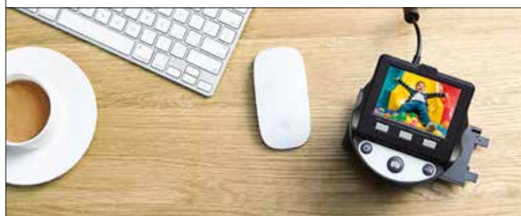
Filmscanner KODAK SCANZA von C+A Global