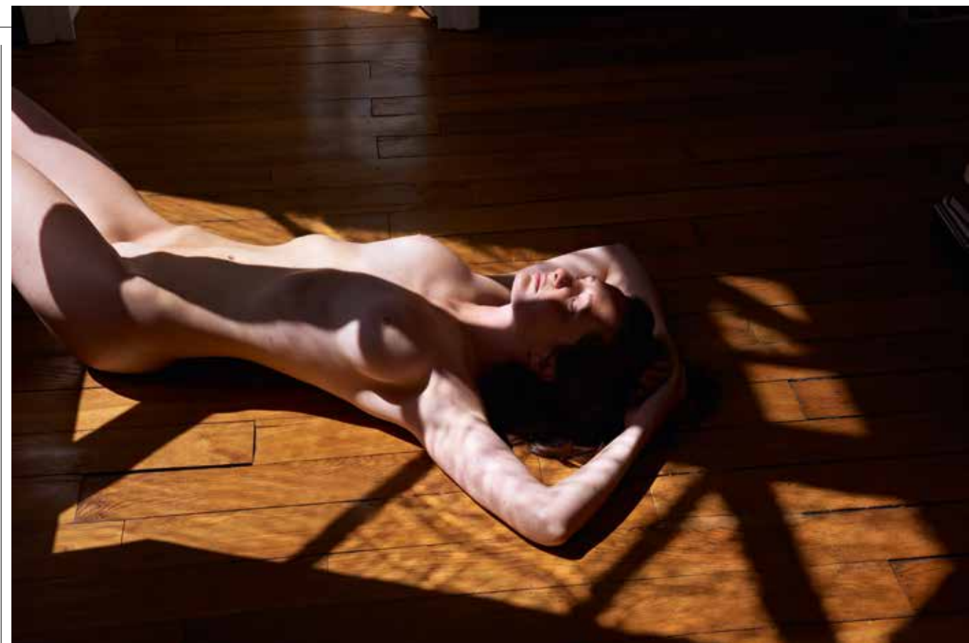
Nue au soleil, Paris, 2015, Foto: © Sonia Sieff