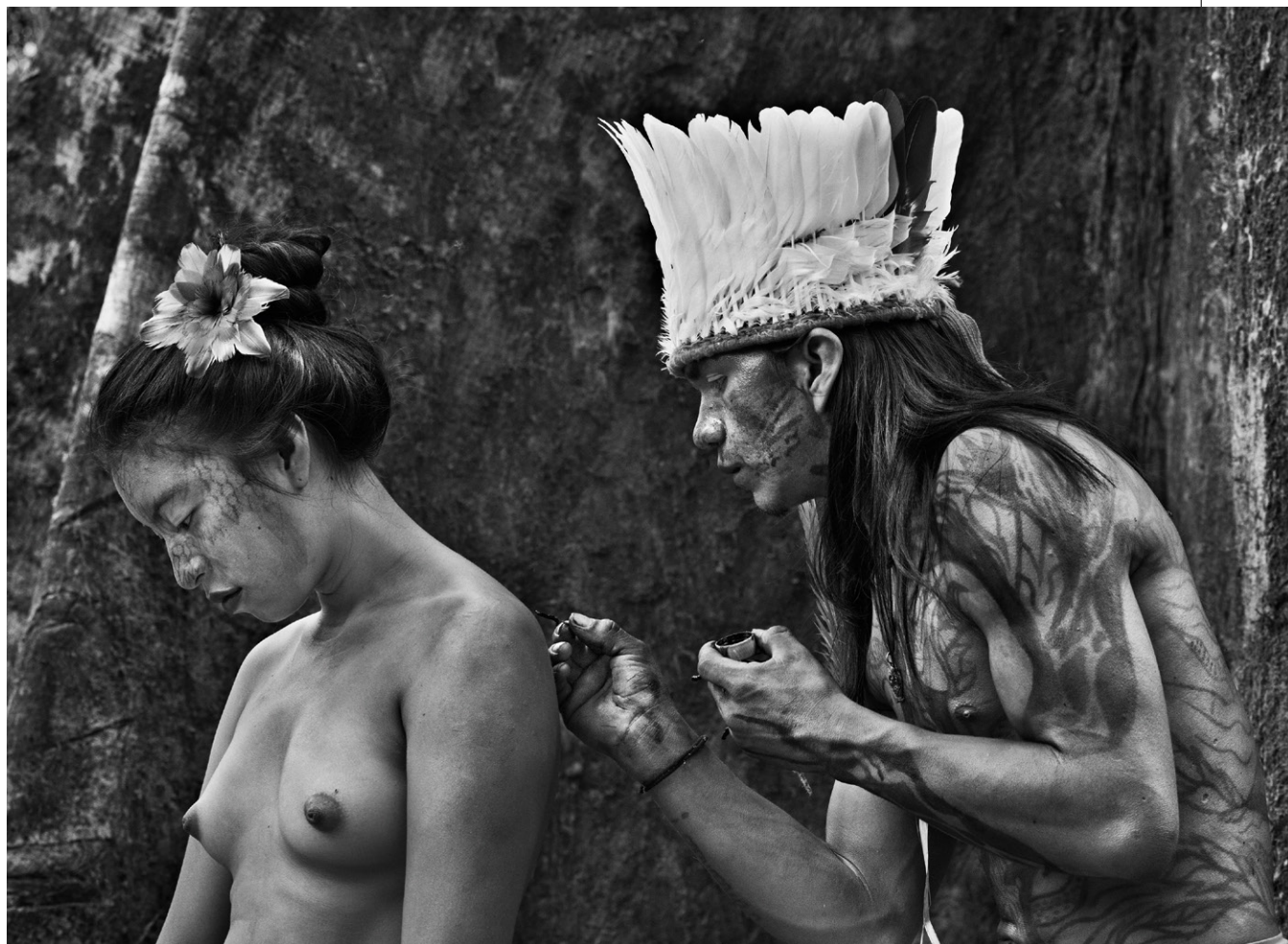
Rio Gregório Yawanawá Indigenous Territory, state of Acre, 2016