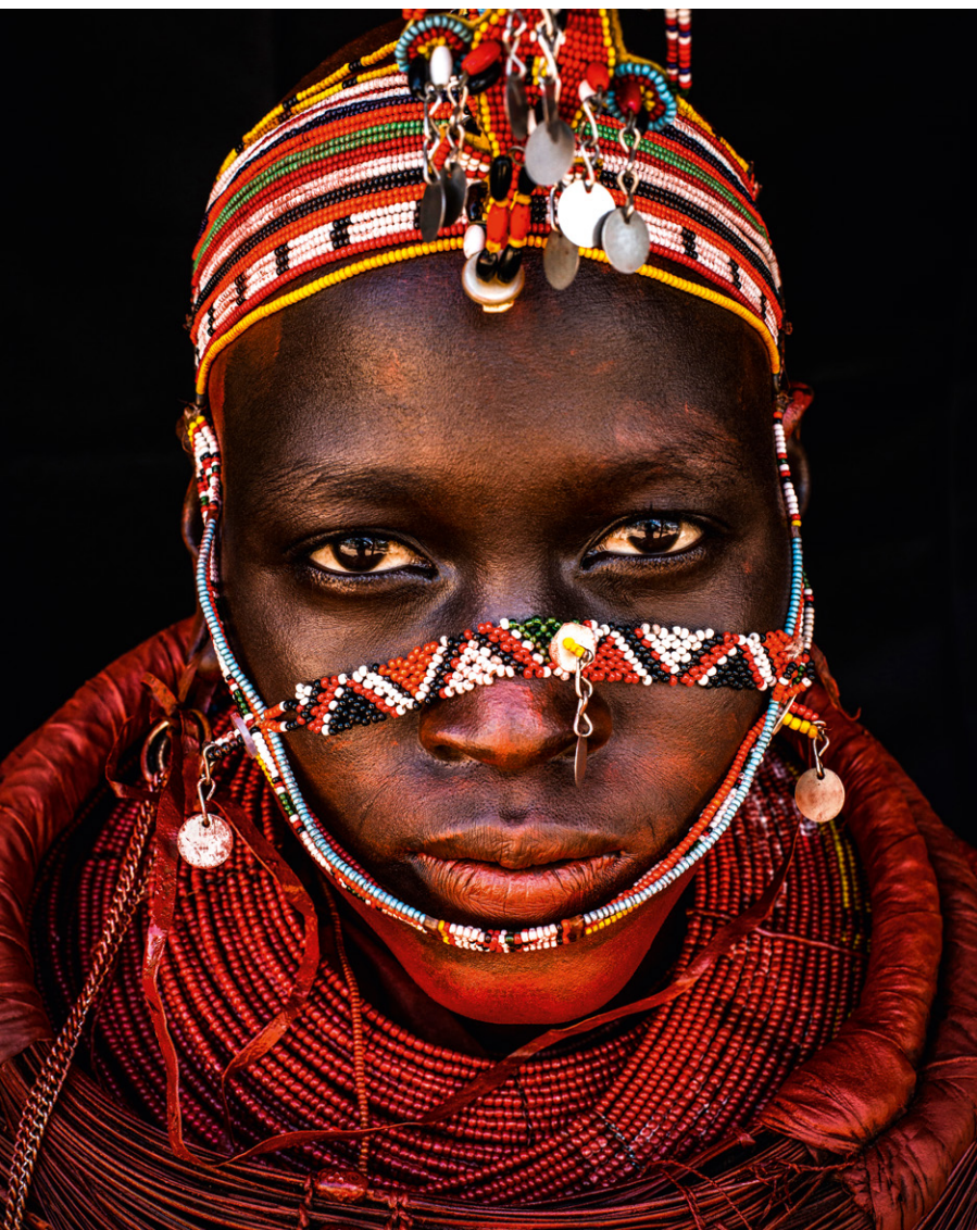
Mario Marino Gesichter Afrikas Seite 34