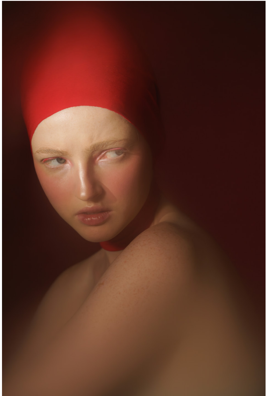
Meta Meta Medieval, 2023, Foto: © Maya Shishkina, Singapore