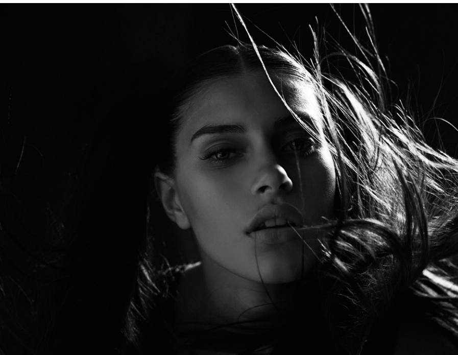
Joachim Baldauf Licht und Liebe Seite 40