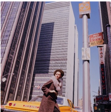
F.C. Gundlach, „ Karibikreise mit der SS United States “, Stopp in New York mit Belinda , New York 1965