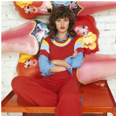
F.C. Gundlach, Uschi Obermaier , Hamburg 1970