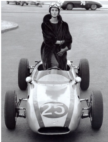
F.C. Gundlach, „Im Fahrerlager“ , Berlin, Avus, 1963