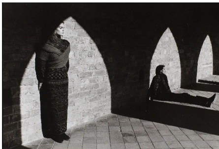
Ute Mahler, Zwei Models im Kreuzgang , 1989 © Ute Mahler