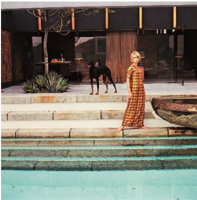
F.C. Gundlach, Gunel Person in der Villa Berna[r]des, Rio de Janeiro, 1963