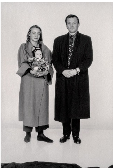
F.C. Gundlach, Familie Kippenberger , Hamburg ca. 1986