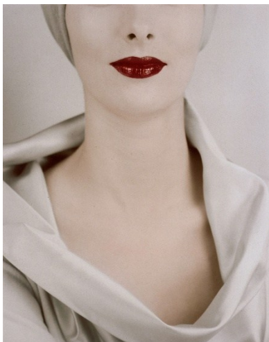
Erwin Blumenfeld, Decolleté, New York 1950er Jahre © 2026 Lisette Georges - Blumenfeld Foundation, NYC