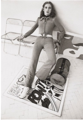
F.C. Gundlach, Maud Adams für Falke Fashion , Hamburg 1971 © F.C. Gundlach, Courtesy Stiftung F.C. Gundlach