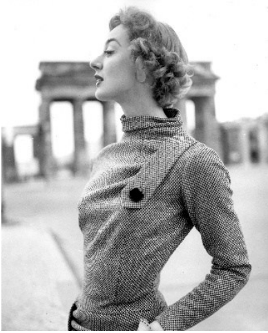
F.C. Gundlach, „Kostüme der Saison“, Eleanor vor dem Brandenburger Tor, Berlin (West) 1955