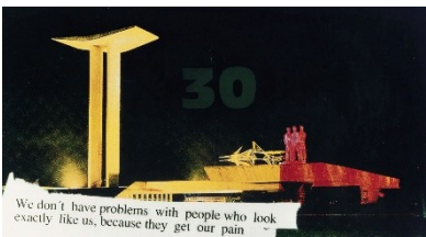
Martin Kippenberger, We don't have problems with people who look exactly like us, because they get our pain , 1989 © Estate of Martin Kippenberger, Galerie Gisela Capitain, Cologne