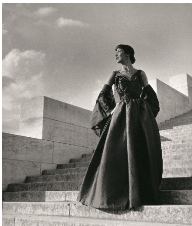
F.C. Gundlach, Abendkleid von Manguin, Paris 1952