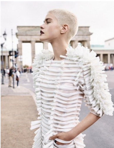
Armin Morbach, „Armin Morbach x F.C. Gundlach“, Berlin 2018