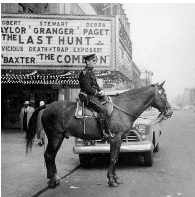
F.C. Gundlach, Berittener Polizist vor einem Kino in Harlem , New York 1956 © F.C. Gundlach, Courtesy Stiftung F.C. Gundlach