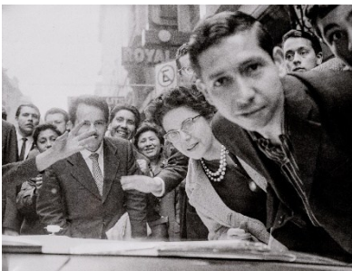
F.C. Gundlach, Massenauflauf beim Besuch der deutschen Models, Santiago de Chile 1963

© F.C. Gundlach, Courtesy Stiftung F.C. Gundlach