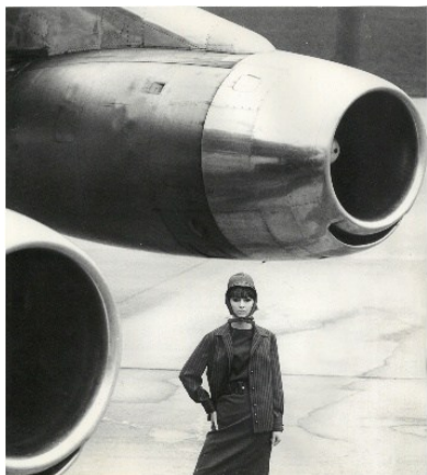
F.C. Gundlach, „Jet Age“ , Hamburg 1963 © F.C. Gundlach, Courtesy Stiftung F.C. Gundlach