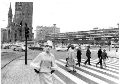
F.C. Gundlach, Biggi in einem Kostüm von Uli Richter vor Breitscheidplatz mit Gedächtniskirche und Bikini-Haus , Berlin 1963 © F.C. Gundlach, Courtesy Stiftung F.C. Gundlach