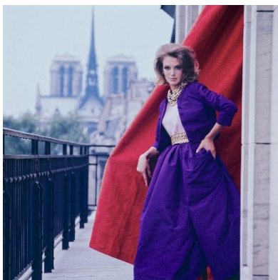
F.C. Gundlach, Auf dem Balkon von Helena Rubinstein , Paris 1963 © F.C. Gundlach, Courtesy Stiftung F.C. Gundlach